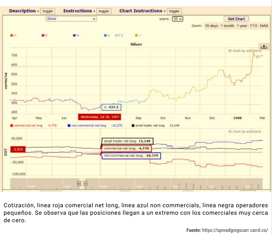
G4 COT y gráfico Futuros sobre la Plata.

Cotización, línea roja comercial net long, línea azul non commercials, línea negra operadores pequeños. Se observa que las posiciones llegan a un extremo con los comerciales muy cerca de cero.